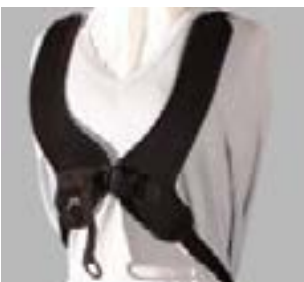
// JAY090040 - JAY090042