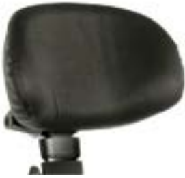
// QPL030430 & QPL030431