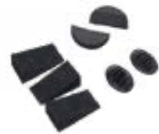
// JAY090029 - JAY090031